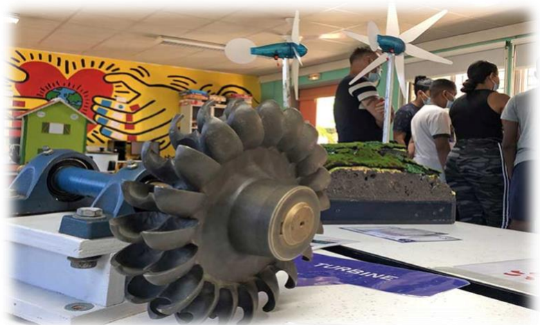
TURBINE HYDRO-ELECTRIQUE POUR UNE ENERGIE RENOUVELABLE :