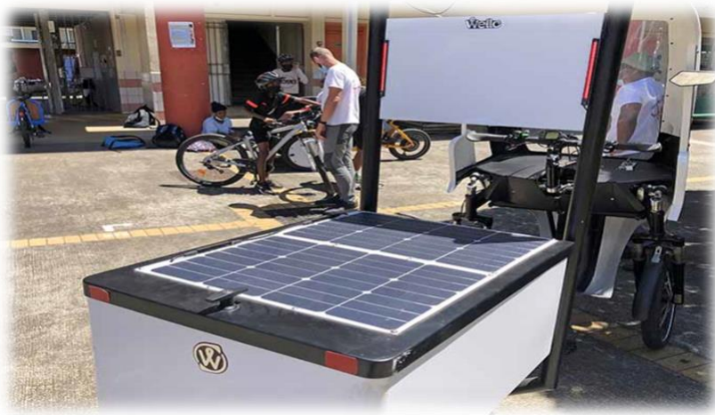
PANNEAU PHOTO-VOLTAIQUE POUR UN DEPLACEMENT DURABLE

Pour cette 1 ère édition, nous avons choisi de limiter la notion de développement durable uniquement dans sa composante environnementale , la plus proche possible du quotidien des élèves du Chaudron, sans chercher forcément à développer une vision trop catastrophiste ni un sentiment de culpabilité .