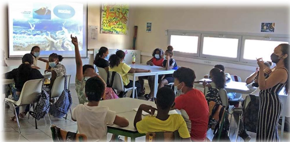
ATELIER SREPEN EN 6 e , SUR LA BIO-DIVERSITE A LA REUNION (salle de réunion)